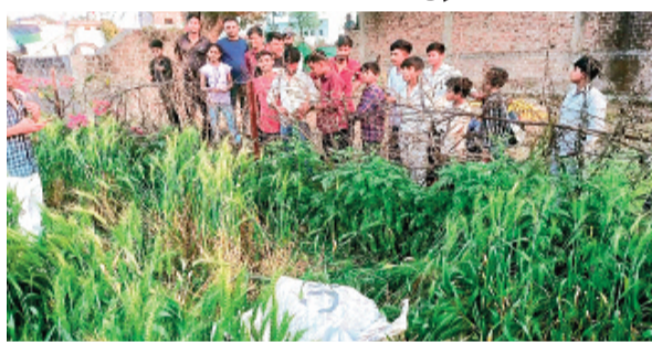
हरिभूमि न्यूज़ ॥ सारंगपुर

पड़ाना नगर के जाटव मोहल्ला स्थित प्रसिद्ध खेड़ापति हनुमान मंदिर से चोरी हुई दान पेटी रविवार देर शाम मंदिर के पीछे जंगल क्षेत्र में टूटी हुई अवस्था में बरामद की गई। अज्ञात चोर बोते सोमवार-मंगलवार की दरमियानी रात मंदिर परिसर में रखी दान पेटी को उठाकर ले गए थे।