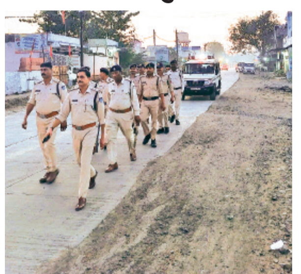
हरिभूमि न्यूज़ ॥ छापीहेड़ा

कानून हर जगह अपना कार्य समर्थकता के साथ सत्य निष्ठा निर्वहन करता है जो हमारी रक्षा के लिए सदैव उपस्थित भी रहता है। सोमवार को छापीहेड़ा में जनसेवा देश भक्ति के सिपाहियों ने मिलकर कदम से कदम की ताल से फ्लैग मार्च निकाला जिसे देख नगर के हर चौराहों पर कई जगह पर लोगों ने सेल्यूट मारकर पुलिस का सम्मान किया। क्योंकि पुलिस बल हमेशा सभी नगरवासियों की रक्षा के लिए 24 घंटे उपलब्ध रहते हैं त्योहारों के चलते अमन और