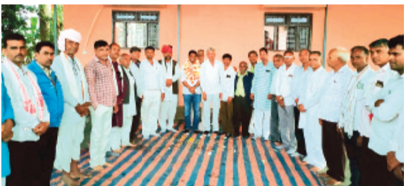
हरिभूमि न्यूज़ ॥ खिलवीपुर

जिनके पालक नहीं हैं, उनका विवाह सम्मेलन में होगा निशुल्क