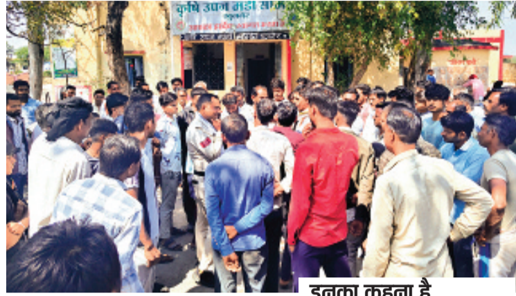
हरिभूमि न्यूज़ ॥ खुजनेर

कृषि उपज मंडी खुजनेर एक बार फिर अव्यवस्थाओं को लेकर चर्चा में है। शुरुवार को व्यापारियों द्वारा काम भव में फसल खरीदी के विरोध में किसानों ने चक्काजाम किया था, जिसमें प्रशासन ने आकर किसानों को समझाकर जाम खुलवाया था। परंतु इसका बाद भी मंडी प्रबंधन ने कोई सीख नहीं ली और हालात जस के तस बने रहे। लगातार परेशानियां झेल रहे किसानों का एक बार फिर सोमवार को आक्रोश फूट पड़ा जब सुबह 11 बजे तक नीलामी प्रक्रिया शुरू नहीं हुई नाराज किसानों ने मंडी कार्यालय के सामने जमकर हंगामा किया। किसानों का आरोप है कि मंडी